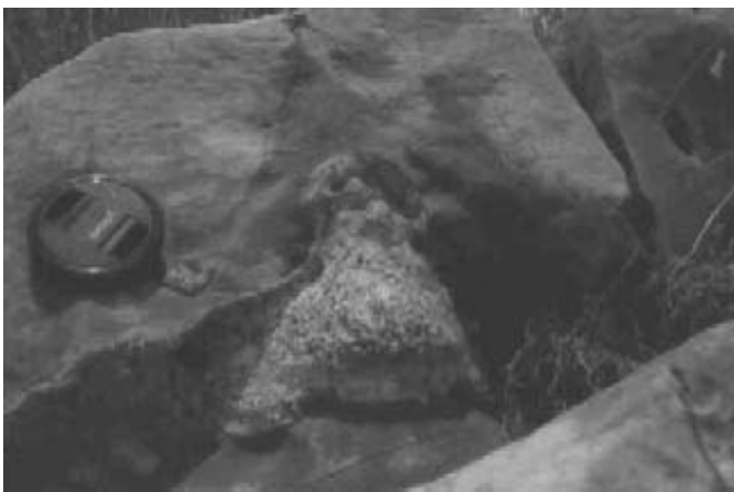
Φωτογραφία 7. Πυριτικής σύστασης σύγκριμα με εμφανή εξωτερική «σπογγώδη υφή», ορεινός δρόμος Αλτομυρά – Παναγία Γιάτρισσα (Κεντρικός Ταΰγετος)

Η αρχική δε υπόθεση τεκμηριώθηκε πλήρως μετά την ανεύρεση παρόμοιων σπογγοαποικιών στα αντίστοιχα πετρώματα του Όρους Ταΰγετος στην Πελοπόννησο, σε εμφάνιση πριν το χωριό Τσέρια, στον Δυτικό Ταΰγετο (Manutsoglu et al. 1997). Στην θέση αυτή τεκμηριώθηκε για πρώτη φορά η ηωκαινική ηλικία των αποικιών, αφού στην ίδια εμφάνιση 60 μέτρα στρωματογραφικά ανώτερα υπάρχουν νουμουλίτες, που είχαν ήδη προσδιοριστεί από τον Thiebault (1982). Σε πάρα πολλές όμως θέσεις και στην Πελοπόννησο υπάρχουν συγκριματικές δομές που και το σχήμα τους και η εσωτερική τους δομή εμπεριέχει ενδείξεις υπολειμμάτων σπόγγων (φωτ. 7).