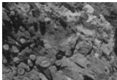
Φωτογραφία 3. Μαύρα δολομιτικά μάρμαρα με σπογγοαποικία, φωτογραφία 4 (δεξιά), λεπτομέρεια της προηγούμενης φωτογραφίας, με απολιθωμένους σπόγγους.

διαμέτρου εκατοστών, εξελίσσονται από 3-4 μέτρα υποκίτρινου σερικιτικού χαλαζίτη. Ο χαρακτηριστικός αυτός σχηματισμός στον μεν Ταΰγετο έχει χρονολογηθεί Μάλμιο (Thiebault 1982), στην Κρήτη δε, και δη στην περιοχή Ασφένδου οι Krahl et al. (1988) αναφέρουν ότι έχουν εντοπίσει τρηματοφόρα και ραδιολάρια του Άππιου και Ανωτέρου Κενομανίου (τα στοιχεία αυτά δεν έχουν ακόμη δημοσιευτεί). Όσον αφορά τους κονδύλους για πολλές δεκαετίες θεωρούντο διαγενετικά συγκρίματα. Όπως διαπιστώθηκε διακρίνονται δυο χαρακτηριστικές ομάδες κονδύλων. Διαγενετικά συγκρίματα όπου το πυριτικό υλικό είναι ομοιογενώς κατανεμημένο και στο μικροσκόπιο δεν εμφανίζει κα-