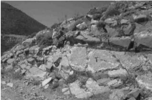
Φωτογραφία 6. Εναλλαγές πλακωδών μαρμάρων με μετακερατολιθικές ενδιαστρώσεις, στην επιφάνεια των οποίων διακρίνεται «σπογγώδης υφή». Εθνικός Δρυμός Λευκών Ορέων, μονοπάτι προς το καταφύγιο του «Καλέρη», Νοτιοανατολικά της πόλης του Ομαλού, ΝΔ Κρήτη.

Η αρχική δε υπόθεση τεκμηριώθηκε πλήρως μετά την ανεύρεση παρόμοιων σπογγοαποικιών στα αντίστοιχα πετρώματα του Όρους Ταΰγετος στην Πελοπόννησο, σε εμφάνιση πριν το χωριό Τσέρια, στον Δυτικό Ταΰγετο (Manutsoglu et al. 1997). Στην θέση αυτή τεκμηριώθηκε για πρώτη φορά η ηωκαινική ηλικία των αποικιών, αφού στην ίδια εμφάνιση 60 μέτρα στρωματογραφικά ανώτερα υπάρχουν νουμουλίτες, που είχαν ήδη προσδιοριστεί από τον Thiebault (1982). Σε πάρα πολλές όμως θέσεις και στην Πελοπόννησο υπάρχουν συγκριματικές δομές που και το σχήμα τους και η εσωτερική τους δομή εμπεριέχει ενδείξεις υπολειμμάτων σπόγγων (φωτ. 7).