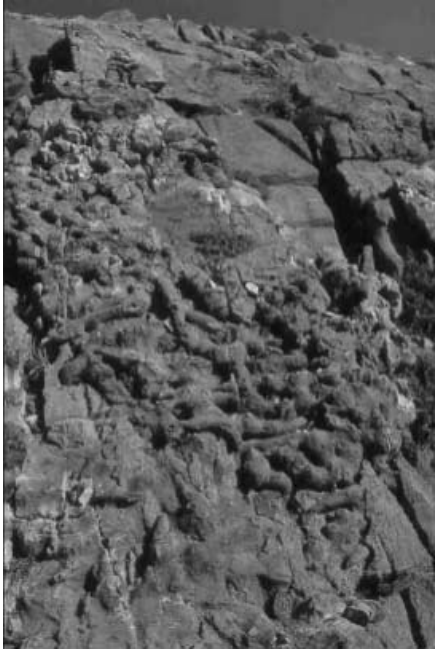
Φωτογραφία 2. Λεπτομέρεια από σπογγοαποικία στον Ψηλορείτη (για κλίμακα, στο μέσο της φωτογραφίας το υψομετρικό).

από την in situ αποδόμιση προϋπαρχόντων σπόγγων, από την συνολική εικόνα των αποικιών πιθανώς να πρόκειται για σπόγγους Siphoniidae και Rhizomorina (Manutsoglu E. et al. 1995b).