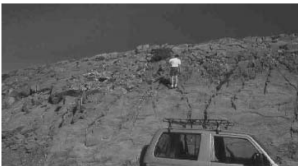
Φωτογραφία 1. Πανοραμική άποψη των σπογγοαποικιών στον Ψηλορείτη.

Αν και οι συνθήκες μεταμόρφωσης δεν επιτρέπουν μια σίγουρη ερμηνεία των ευρημάτων επέτρεψαν τις εξής θεωρήσεις: α) Πρόκειται για απολιθωμένους δημόσπογγους που σχημάτισαν επάλληλα 'flat sponge mounds', β) τα υποστρώματα πάνω στα οποία αναπτύχθηκαν οι αποικίες πιθανώς να ήταν σπικουλίτες, που προκύψαν