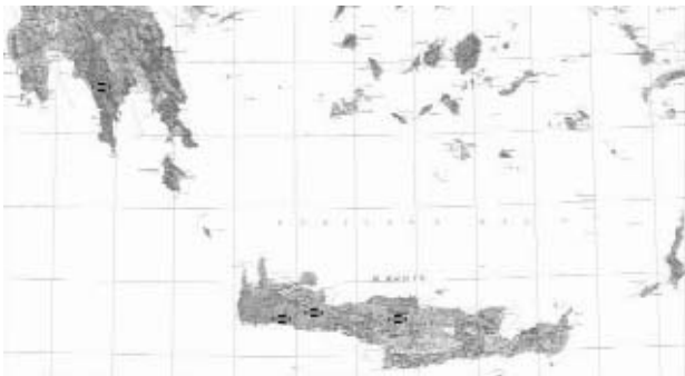
Σχήμα 2. Με υπόβαθρο του νότιου τμήματος του γεωλογικού χάρτη της Ελλάδος του ΙΓΜΕ κλίμακας 1:500000, θέσεις εμφανίσεων των σπογγοαποικιών.

Ύστερα από την διαπίστωση της πρώτης ηωκαινικής ηλικίας απολιθωμένης σπογγοαποικίας (Manutsoglu E. et al. 1995b), γεννήθηκε αυτόματα το ερώτημα της χωρικής και χρονικής τους διασποράς. Η πρώτη αποικία βρέθηκε στην περιοχή του Ψηλορείτη, μετά τα Ανώγεια στην Κεντρική Κρήτη (Σχ. 2, φωτ. 1 και 2).