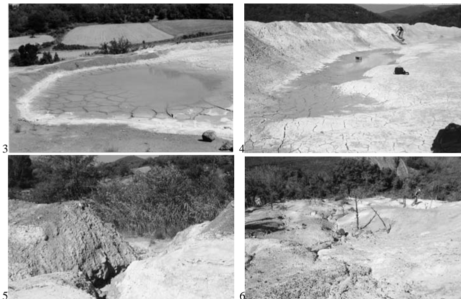
Σχήμα 3. Λευκά θειικά ορυκτά άλατα στην αποστεγνωμένη περιφέρεια λιμνάζοντος νερού στη λεκάνη τελμάτων 3. (φωτογράφιση: Μάιος 2001).

Τα ορυκτά αυτά άλατα σε περιόδους υγρασίας αναδύονται και συγκεντρώνονται στην επιφάνεια και δημιουργούν σε περιόδους ξηρασίας ένα εντυπωσιακό ξασπρισμένο τοπίο (Σχ. 4). Πρέπει να σημειωθεί ότι τα θειικά αυτά προϊόντα είναι ευδιάλυτα στο νερό, γεγονός που έχει δραματικές επιπτώσεις στην εκπομπή τοξικών μετάλλων από το ξέπλυμα των βρόχινων νερών ενώπιον των εκπληκτικά υψηλών τιμών που δείχνει ο Πίνακας 2. Θραύσεις και ολισθήσεις των τοιχωμάτων και τελμάτων των λεκανών (Σχ. 5 και 6) επιδεινώνουν βέβαια τη δραματική αυτή κατάσταση.